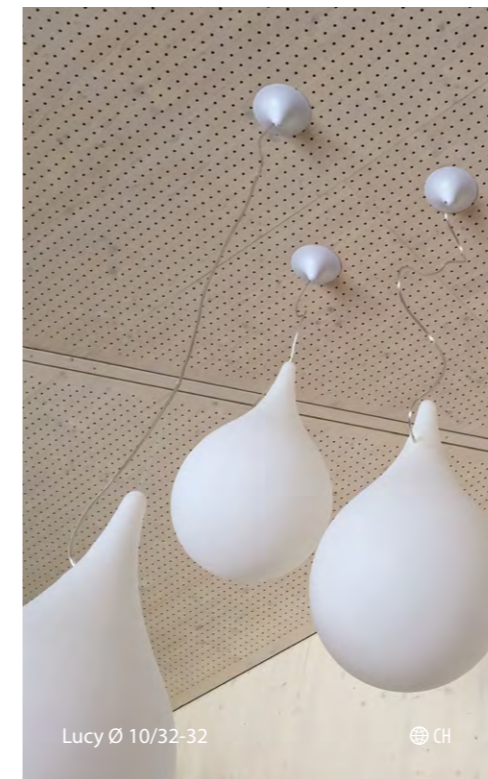
Lucy Ø 10/32-32