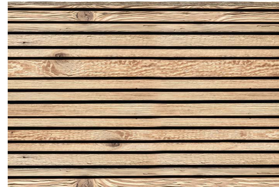
Marilyne S3, ALTHOLZ 1